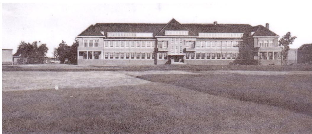
Heerenveen – Ziekenhuis