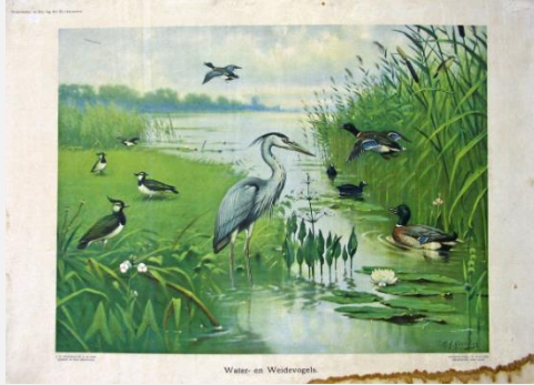
Schoolplaat op karton "Water- en weidevogels".