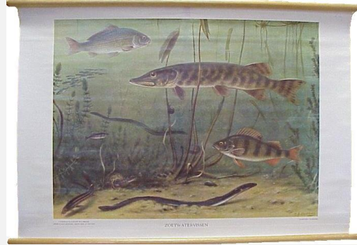
Schoolplaat op linnen "Zoetwatervissen".

F. K., oud 26 jaren, te Boijl, stond terecht wegens diefstal, althans de kantonrechter oordeelde, dat het misdrijf niet was overtreding der jachtwet. Hij (K.) had n.l. 4 Nov. een korhoen, die aangeschoten was, zien neervallen, deze opgezocht en mee naar huis genomen. De kantonrechter, van meening, dat in casu diefstal gepleegd was, verklaarde zich onbevoegd in deze uitspraak te doen. Het O. M. oordeelde echter weder, dat het feit wel degelijk was: overtreding der jachtwet en concludeerde tot verwijzing der zaak naar den eersten rechter.