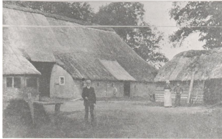
de oude boerderij rond 1915. Jelke de Vries, zijn vrouw en zoon

Het burgerhuis werd gebouwd rond 1959 en is particulier verhuurd.