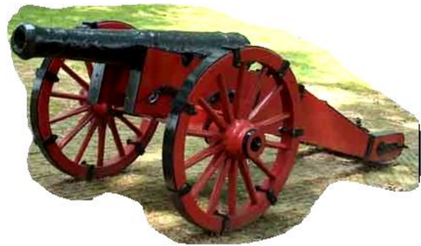
1979: kanon uit de 80 jarige oorlog gevonden in de Linde bij Bekhofschans

Wij, in onze welvaart maatschappij kunnen ons als bewoners van dit zelfde gebied dit eigenlijk niet voorstellen. Troepen die moordend, plunderend en brandstichtend keer op keer voorbij kwamen. Akkers, vee, huis en haard, ja alles vernielden. Zoveel mensen die omkwamen....! Laten we blij zijn met het Boijl van NU.