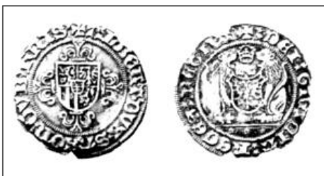
munt van Albrecht van Saksen ±1500 zo zal blijven.

In 1498 wordt Friesland verpand aan de hertog Albrecht van Saksen voor 250.000 goud guldens.