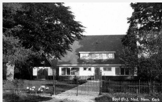
De nieuwe pastorie in Boijl idnr 102933