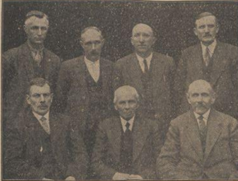
HET BESTUUR DER IJSCLUB.