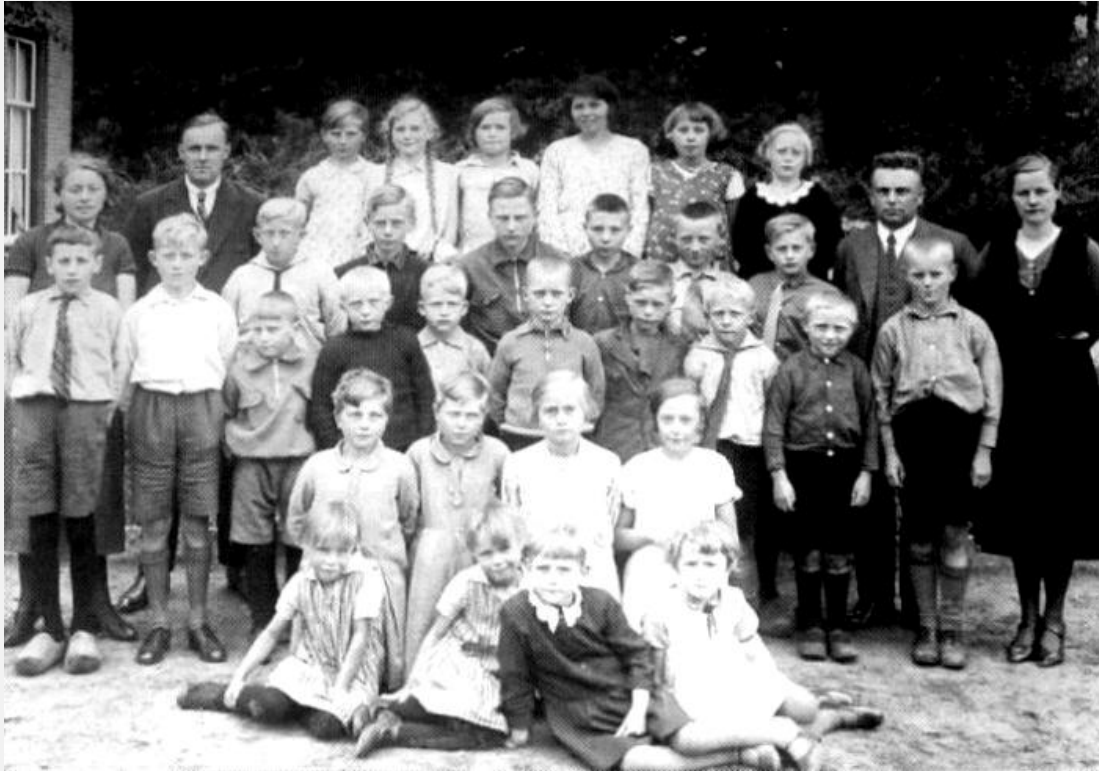
Groep leerlingen van de ols in Boijl.

In 1937 telde de openbare lagere school in Boijl iets meer dan 100 leerlingen.