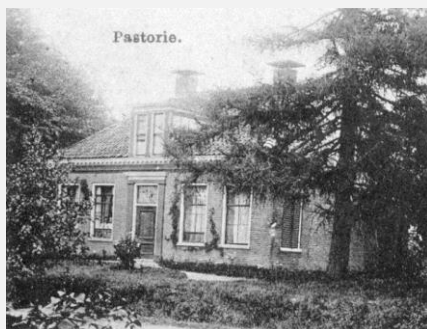
De oude (en eerste) pastorie in Boijl idnr 102931 - beelddatum vóór 1933

In 1937 werd in Boijl een nieuwe pastorie gebouwd door het plaatselijke bouwbedrijf Prakken & Hoogeveen. Hiervoor werd eerst de oude in 1860 gebouwde pastorie gesloopt.