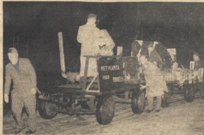
Met Planta meer pukkels, de nieuwjaarsverassing te Boijl.

De als zuivelbewerker verklede jeugd deelde zuivelproducten uit. Velen gingen naar huis met koffiemelk, room, melk, boter en kaasjes. Ook ging een vertegenwoordiger van het eerstgenoemde product het de mensen aanbieden. De miniatuur witte doosjes met blauwe band waren echter weinig in trek. Er was verder een spreker aanwezig, die zei het te houden op puur natuur. Het moest niet zo zijn, zei hij, dat door boeren margarine gegeten wordt. Hij had dat nl. meer dan eens geconstateerd. Spreker zei, dat deze stunt tevens een lustrum was. Deze vijfde stunt was goed en gezellig. Nadat velen elkaar nog een gelukkig nieuwjaar gewenst hadden ging men naar huis. Na enen was Boijl weer geheel en al rust.