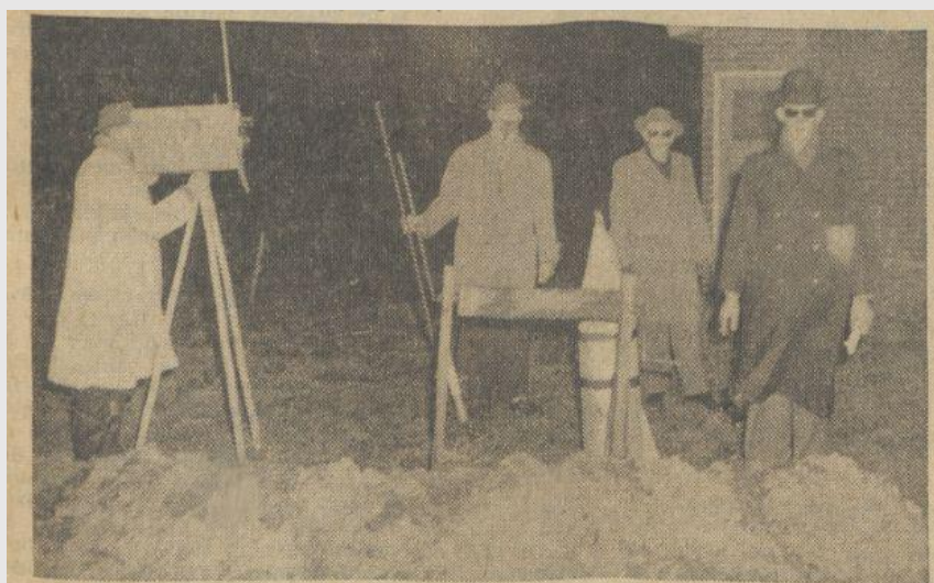
Het gat van Boyl, met excellenties, NTS-reporter en staatssecretarissen compleet.

Zowel de geitenfokverenigingen als de jeugd van Boyl en omgeving hebben het dit jaar dus weer mooi versierd. Er is ons verteld dat men in Nije- of Oldeholt-pade ook op een soortgelijke manier aan het stunts wilde gaan, hetgeen slechts toe te juichen is. Dergelijke plezierige en algemene vieringen steken wel gunstig af bij de herrie, die in de meeste andere plaatsen op oudejaarsavond gebruikelijk is.