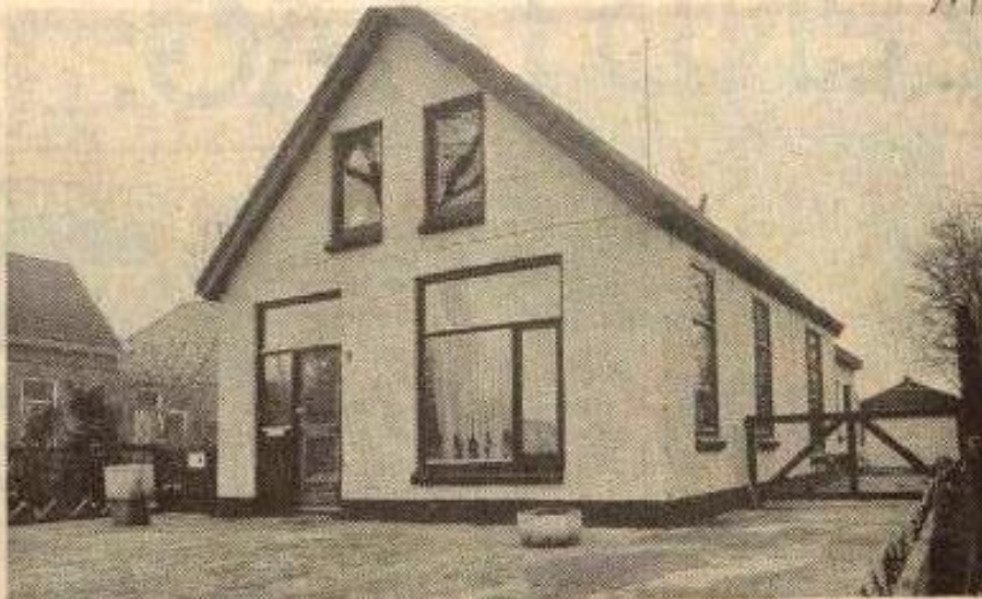
De „hasj-boerderij” in Boijl