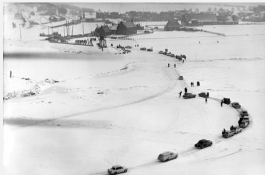
auto's reden over het dicht gevoren IJsselmeer