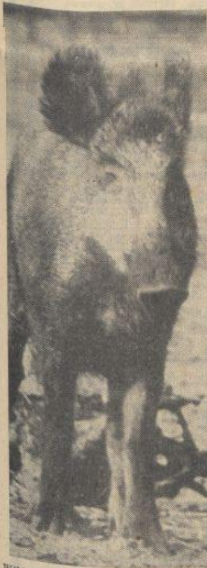
Wilde zwijnenjacht rondom Zorgvlied en dit is een jeugdportret van een der slachtoffers. Die intussen flink wat groter was geworden. Deze foto is gemaakt in december 1959 en wij hebben hem gisteren weer zien lopen: een beste volwassen wilde beer.

Zo kregen wij gisteren bericht en we konden ons vervoegen in de Jachthut bij Boschoord. In jagerskringen een heel beroemde plaats van samenkomst, midden in het prachtigste wildgebied, daar op de grens van drie provinciën. Zelfs Prins Bernhard is daar wel als gast ontvangen. Wij vonden zo tegen twaalf uur al een heel gezelschap in die Jachthut — de sporenzoekers waren de hele morgen al bezig geweest en hadden een zwijn gespoord. In het Stormbos, maar het sporen was moeilijk werk, omdat er nu en dan een sneeuwuiltje overtrok en alles dus verdoezelde. Het wachten was verder op de komst van meer geweren — tegen één uur zou de zaak wel los gaan.