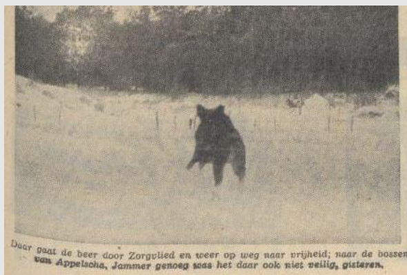
Daar gaat de beer door Zorgvlied en weer op weg naar vrijheid; naar de bossen van Appelscha, Jammer genoeg was het daar ook niet veilig, gisteren.