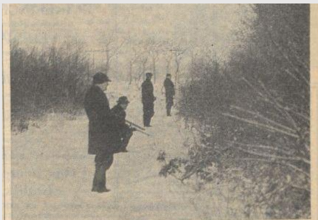
Heel dicht stonden de geweren bij elkaar; er waren er meer dan twintig. Dat zou een kannonade hebben gegeven van je welste..