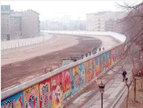
de Berlijnse muur

Afgelopen nacht verbrak de DDR onverwacht alle verbindingen met West-Berlijn en begonnen 80.000 DDR-militairen met de aanleg van een 45 km lange prikkeldraadversperring dwars door Berlijn. In de maanden daarop volgde in hoog tempo de vervanging van de versperring door een hoge stenen muur. De muur scheidde de beide stadsdelen hermetisch en maakte een einde aan het onderlinge vrije verkeer. Tenslotte resulteerde dit in het IJzeren Gordijn, de fysieke scheiding tussen Oost- en West-Duitsland.