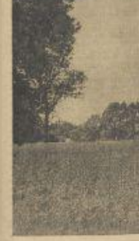
De Meulepolle is een vogel die vaak voorkomt in de omgeving van de meulepolle.

M ischien laatste stukje Saksisch landschap bij ons in Friesland