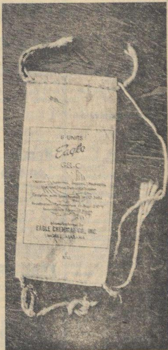
voor tekst zie rechts