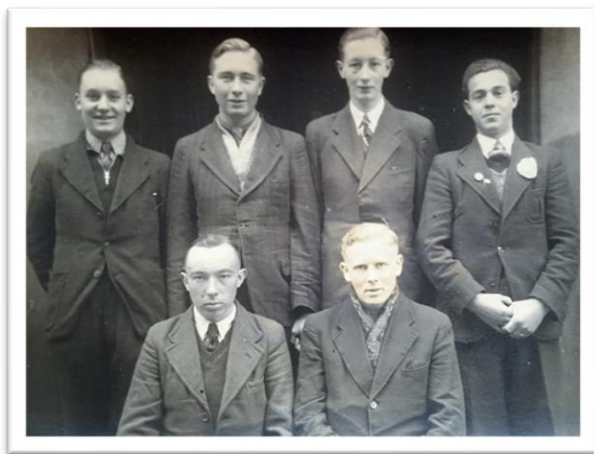
Op deze foto een zestal mannen die in Duitsland werkten op eerdergenoemde scheepswerf Finkenwerder bij Hamburg.