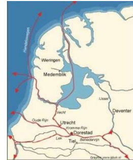
situatie vóór 1287

1287 wordt Friesland getroffen door de st. Lucia springvloed die grote gaten in de kusten slaat en het IJsselmeer zijn huidige vorm geeft.