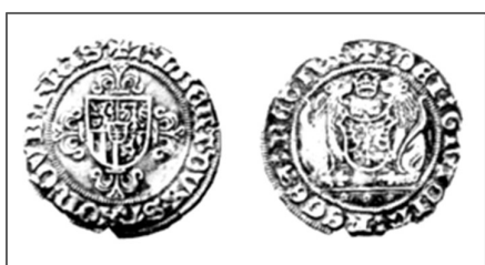
munten van Albrecht van Saksen ±1500

In 1498 wordt Friesland verpand aan de hertog Albrecht van Saksen voor 250.000 goud guldens.