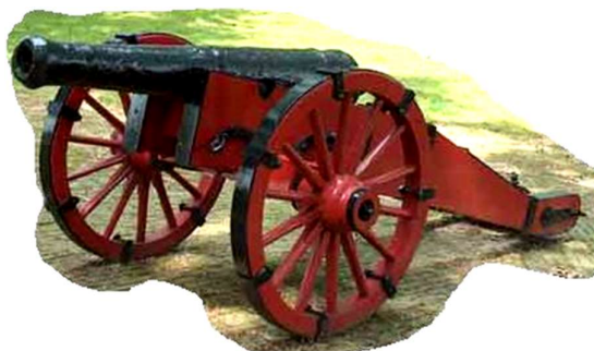
1979: kanon uit de 80 jarige oorlog gevonden in de Linde bij Bekhofs chans

Laten we blij zijn met het Boijl van NU.