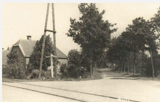
idnr 102882 - beelddatum is vóór 1933