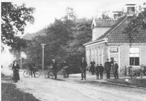
Het bondscafé annex tramhalte in Boijl, met het adres Boijl 90a. beelddatum ca.1915