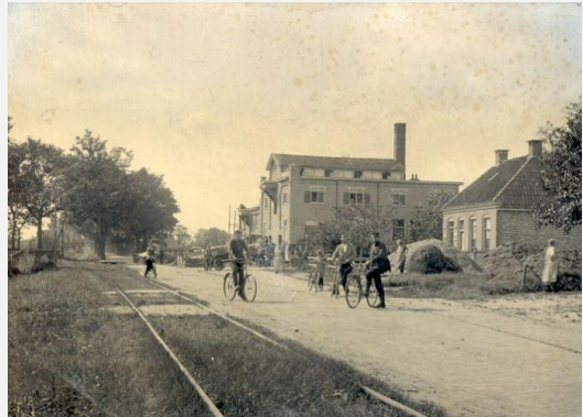
idnr 102886 – beelddatum is na 1914.