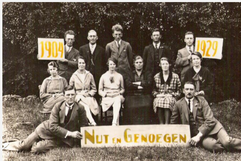
De 25-jarige toneelvereniging "Nut en Genoegen" in Boijl beelddatum 1929

De toneelvereniging "Nut en Genoegen" werd in 1904 opgericht. In 1929 werd het 25-jarig en later in 1954 het 50-jarig bestaan gevierd. De vereniging was 'springlevend'.