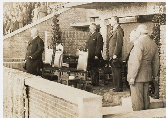
De opening werd verricht door ZKH Prins Hendrik

Medio jaren '20 werden de Olympische Spelen toegewezen aan Amsterdam. De stad werd verkozen boven Los Angeles. De toewijzing leidde niet zonder slag of stoot tot het startsein van de totstandkoming van het Olympisch Stadion. De overheid wees namelijk op 06-05-1926 de aanvraag tot subsidiëring van het stadion af, omdat tijdens de Spelen ook op zondag (!) wedstrijden gehouden zouden worden. Omdat deze afwijzing het verlies van de Olympische Spelen aan een ander land zou betekenen, stond de Nederlandse bevolking spontaan op en zamelde binnen afzienbare tijd 1,5 mio gulden in. Het was niet de overheid maar de Nederlandse bevolking die de Olympische Spelen en de huisvesting ervan uiteindelijk mogelijk maakte. Samen met de lening van 0,5 mio gulden, die het gemeentebestuur van Amsterdam ter beschikking stelde aan het NOC, kon het stadion gerealiseerd worden.