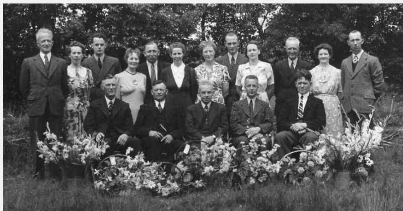
De 50-jarige toneelvereniging "Nut en Genoegen" in Boijl beelddatum 1954