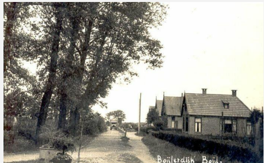
idnr 102865 - beelddatum is vóór 1933.