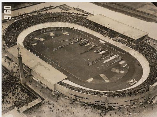
Het Olympisch Stadion in Amsterdam tijdens de opening op 28 juli 1928.