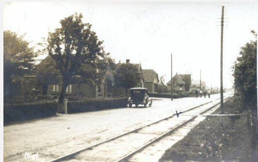
idnr 101233 - beelddatum is vóór 1933.