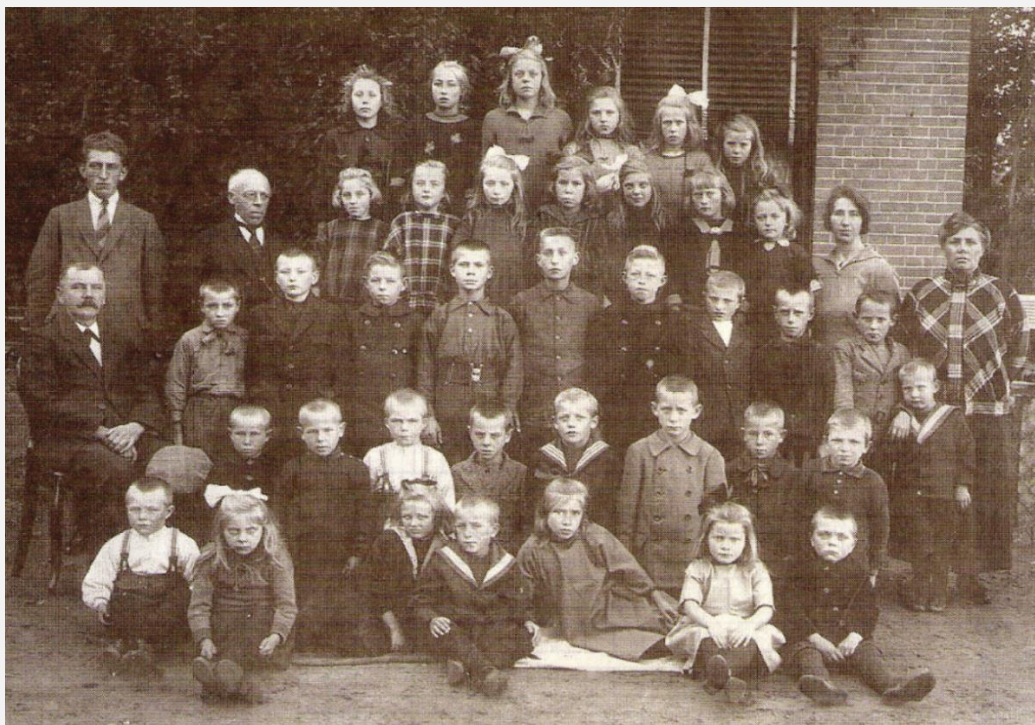
Groep leerlingen van de Openbare Lagere School in Boijl in het jaar 1926.

In het jaar 1926 telde de Openbare Lagere School in Boijl 159 leerlingen.