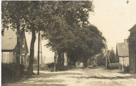
idnr 102876 – beelddatum is tussen 1914-1933.

Hieronder enkele dorpsbeelden van Boijl rond de periode (ongeveer) het jaar 1925. (bron: Fries Fotoarchief)