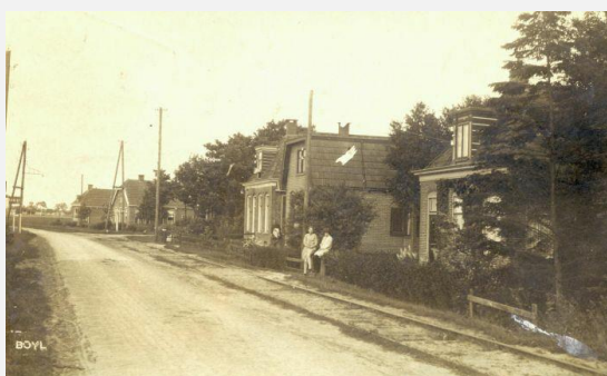
idnr 101235 – beelddatum is vóór 1933.