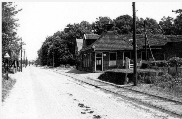
Het café met los- en laadplaats van de NTM-tramlijn. beelddatum ca.1950

Na aanleg en in gebruik neming van de lokale tramlijn Steenwijk-Oosterwolde door de N.T.M. in 1914 werd de locatie van het café tevens tramhalte. Later werd ook een eenvoudige los- en laadplaats aangelegd. De tramlijn bleef bestaan tot 1962.