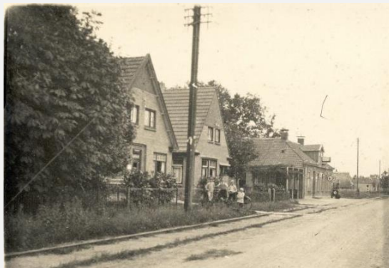
idnr 101241 - beelddatum is vóór 1933