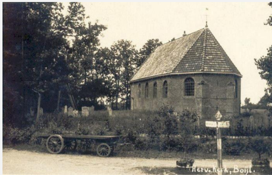
idnr 102927 - beelddatum is vóór 1933.