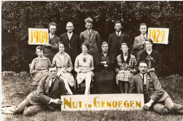
1929 - Toneelvereniging "Nut en Genoegen" in Boijl bestond 25 jaar.

Na deze crash sloten veel landen hun grenzen om de eigen economie te beschermen. Dit was het begin van een economische wereldcrisis. Een jaar later sloeg de crisis in Nederland toe. De im- en export halveerde in zeer korte tijd. Bedrijven gingen failliet en de werkloosheid steeg dramatisch.