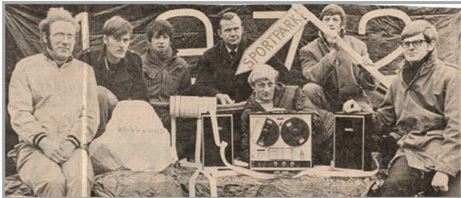
een bandrecorder voor het hele dorp (foto 'Aanpakken')

In 1966 -'Boijl zonder kuil'- werd voor de AHB met veel spektakel alvast een nieuw stuk weg aangelegd en de nieuwe asfaltweg kwam er!