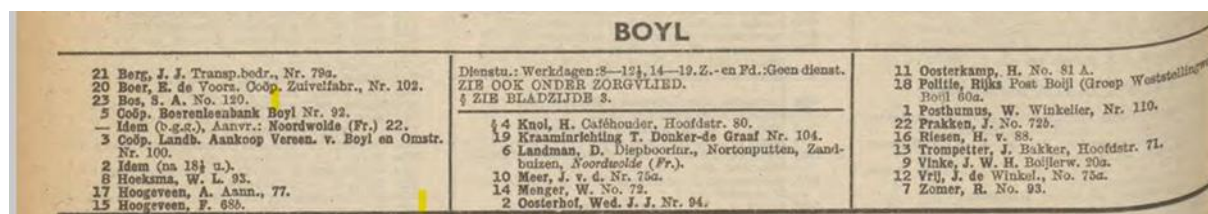
1950 (§ = bereikbaar buiten de kantooruren van de lokale centrale)