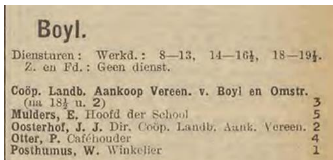
1931: vijf aansluitingen.

In 1946 krijgen de mensen weer moed en zijn er zes nieuwe aansluitingen.