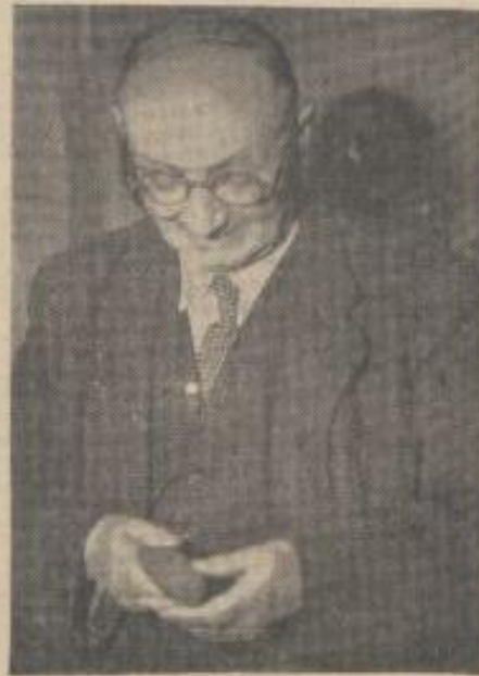
De Boijler archeoloog vertelt van een gevonden werkplaats