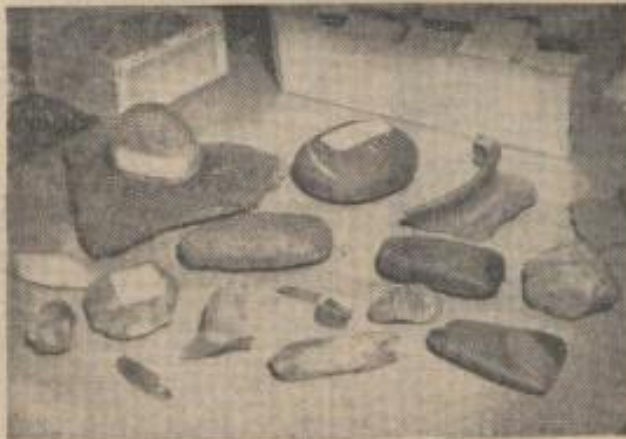
Op deze foto ziet men verschillende scherven, bijl., koper, bronzen en werktuigen

Het duurtje niet lang, of de heer Voerman was al bezig een klein deel van zijn bezittingen op de tafel uit