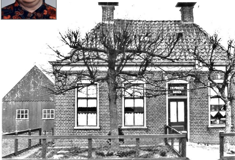
T(iede)W Prakken. Links de oude paardenstal van de meelfabriek.

(het jaartal van deze foto is onbekend, boven de deur staat